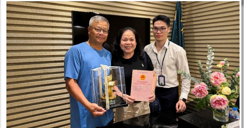
Cuối tháng 6/2024, Victoria Village (TP.Thủ Đức) trao sổ hồng cho cư dân các căn nhà thấp tầng tại dự án