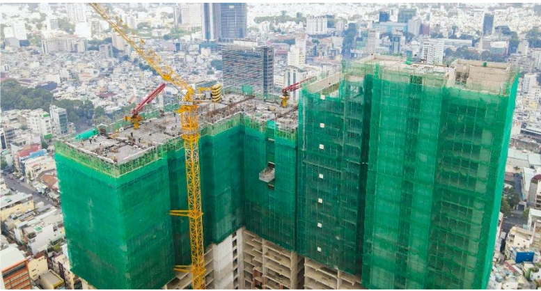
The Grand Manhattan liên tục lên tầng và thay đổi diện mạo rõ nét. Dự kiến sẽ cất nóc Tháp B2 trong năm 2024