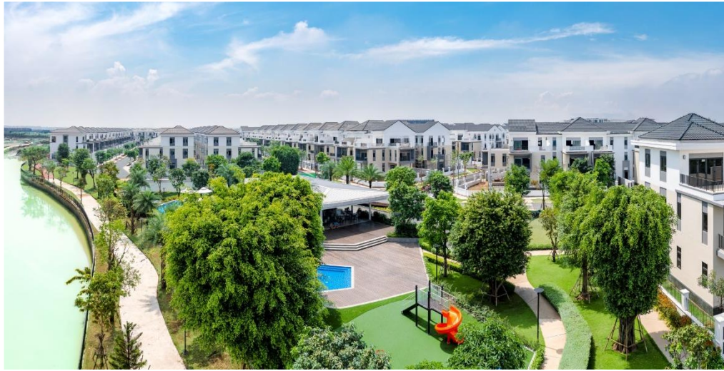
Aqua City – Đô thị sinh thái phía Đông TP. Hồ Chí Minh