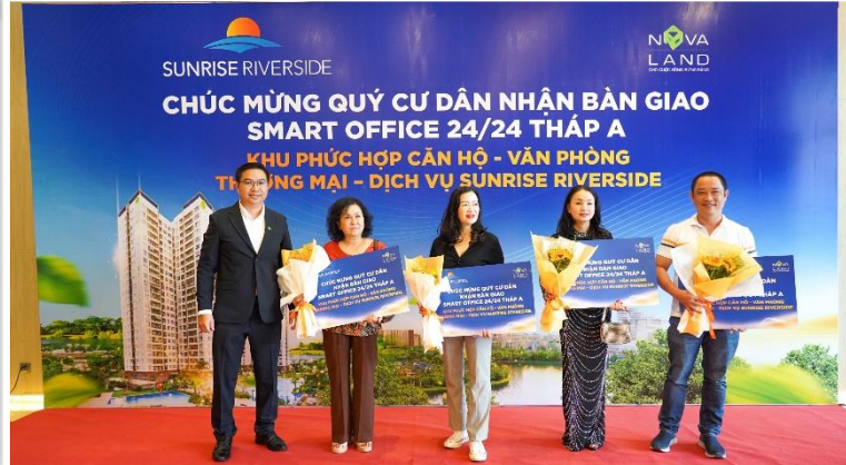
Sunrise Riverside chính thức sổ hồng cho cư dân tháp G1 và Bàn giao Smart Office 24/24 cho cư dân tháp A (G6) vào 20/07 vừa qua